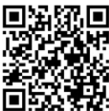
Денежное довольствие военнослужащих по контракту

освобождение от уплаты транспортного налога; снижение платы за арендуемые помещения и земельные участки из государственной собственности до 1 рубля за год; единовременная социальная выплата в размере 169 тысяч рублей на приобретение и установку внутридомового газового оборудования; освобождение семьи ребенка военнослужащего от платы в государственных и муниципальных дошкольных образовательных организациях; представление бесплатного горячего питания детям 5-11 классов государственных и муниципальных образовательных учреждений.