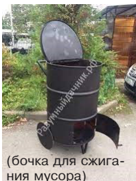
(бочка для сжигания мусора)

а) выкопать ров (яму) глубиной 0,3 м (не меньше) и шириной до 1 м (не больше), либо надежно установить металлическую бочку (другую емкость из негорючих материалов) объемом до 1 куба (не больше). Главное исключить возможность распространения пламени и выпадения сгораемых материалов за пределы очага горения.